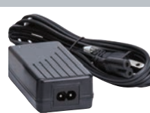
Adaptador de Corrente Alternada